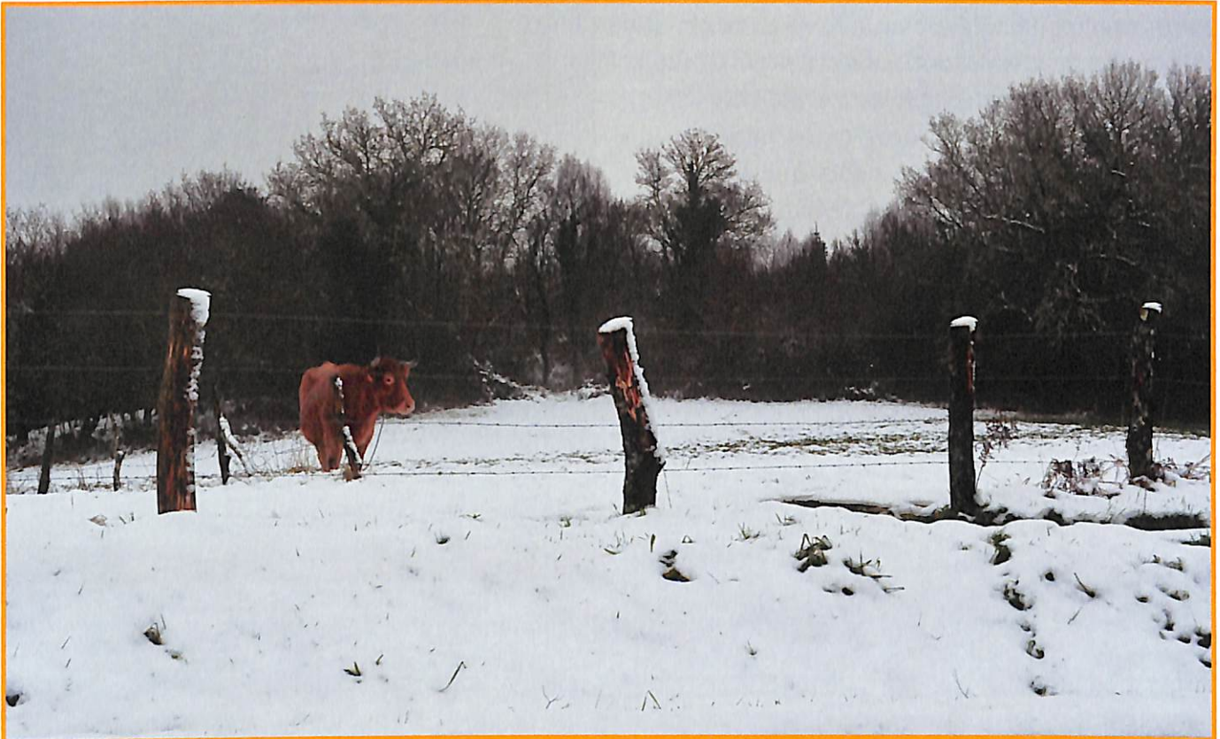
Figura 16. Terreo pequeno dunha pequena explotación

situacións críticas; non quedaba entón outra solución que a aplicación do asociacionismo para así xuntar terras e poder acadar actividades rendibles. Tamén se deducía que non era fácil a curto prazo e tendo en conta a idiosincrasia do pobo galego no rural. Aínda que se acadasen proxectos deste estilo, difícil sería o seu funcionamento, como en moitos casos así o confirmaron os feitos. Por conseguinte, unha opción con aspectos positivos de difícil aplicación instantánea.